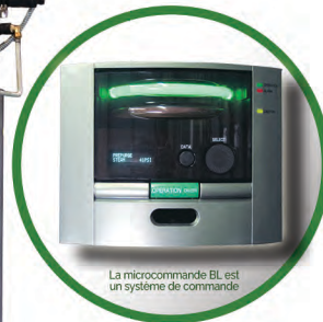
La microcommande BL est un système de commande