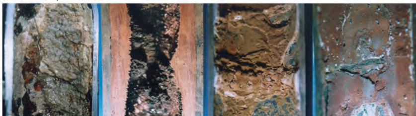
Exemples d'échelle de chaudière

TOUS les modèles Série EX de Miura sont livrés avec un thermocouple attaché directement au tube afin d'alerter l'utilisateur en cas de début d'accumulation de tartre et lui permettre d'identifier et de réparer la source. Le tartre peut être nettoyé pour permettre à la chaudière de retrouver son efficacité d'origine et d'économiser des dizaines de milliers de dollars en gaspillage d'énergie et en frais de réparation.